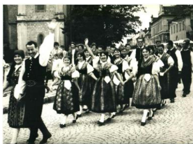
Hlávková nad Vltavou 1966

I když vlastně pracujeme s historií, přesto žijeme dneškem a myslíme na budoucnost. A tuto budoucnost pro nás představují nejenom připravované akce, ale hlavně to, aby s naší generací práce souboru neskončila.