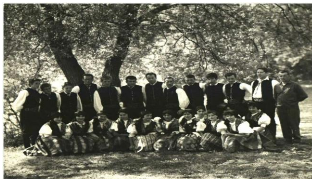
Krojovaná družina 1969